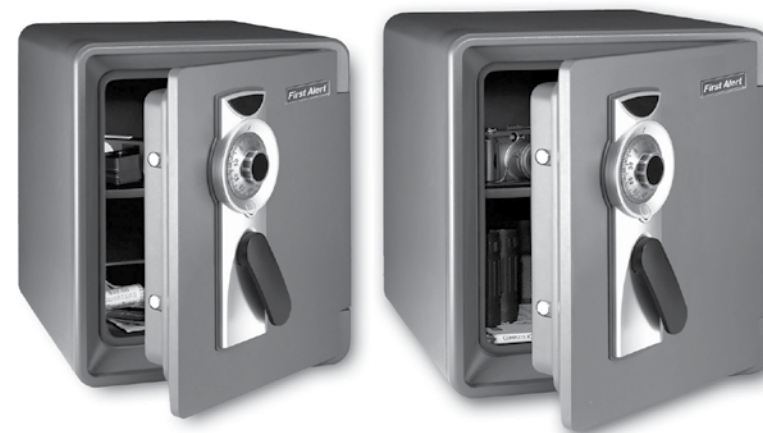
Modèle 2087FA & 2092FA